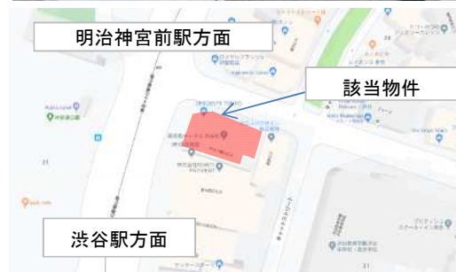
明治神宮前駅方面