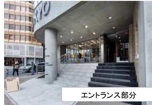
エントランス部分