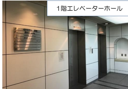
1階エレベーターホール